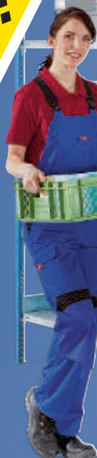
Abb. zeigt 1 Grundregal und 2 Anbauregale (H x B x T 2350 x 3725 x 685 mm)