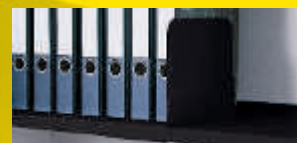
Aktenstützen als Zubehör