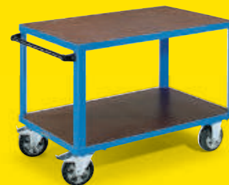
Mit Siebdruckplatten Tragfähigkeit 1000 kg

2 Ladeflächen 1050 x 700 mm Nr. 968 596-KF Fr. 459.– 2 Ladeflächen 1250 x 800 mm Nr. 968 597-KF Fr. 512.–