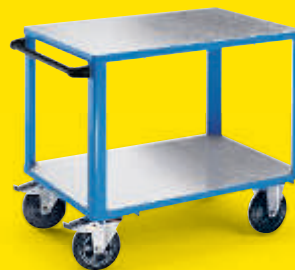
Verzinkte Stahlblech-Auflagen Tragfähigkeit 500 kg

2 Ladeflächen 1050 x 700 mm Nr. 968 591-KF Fr. 369.– 2 Ladeflächen 1250 x 800 mm Nr. 968 592-KF Fr. 462.–