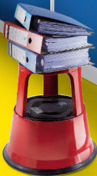
Rollhocker auf der Seite 104.