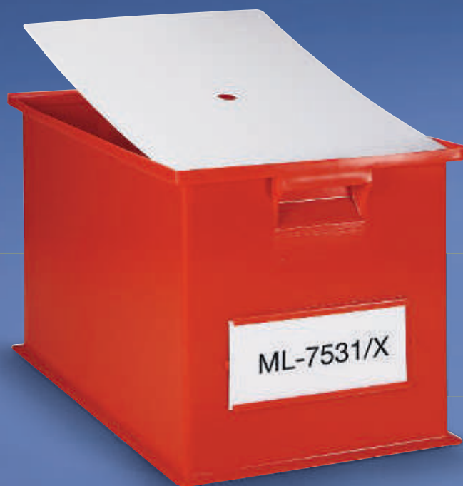
4 Mit Staubdeckel (Zubehör)

ERFOLGS GESCHICHTE TOP QUALITÄT! Ab Fr. 169.–