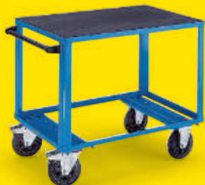
Mit Kunststoff-Ladefläche Tragfähigkeit 500 kg

Zu Ihrer Sicherheit Alle Ausführungen mit Doppelstopp nach EN 1757-3 serienmäßig.