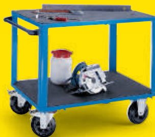
Mit Kunststoff-Ladeflächen Tragfähigkeit 500 kg

1 Ladefläche 1050 x 700 mm Nr. 968 593-KF Fr. 368.– 1 Ladefläche 1250 x 800 mm Nr. 968 594-KF Fr. 401.–